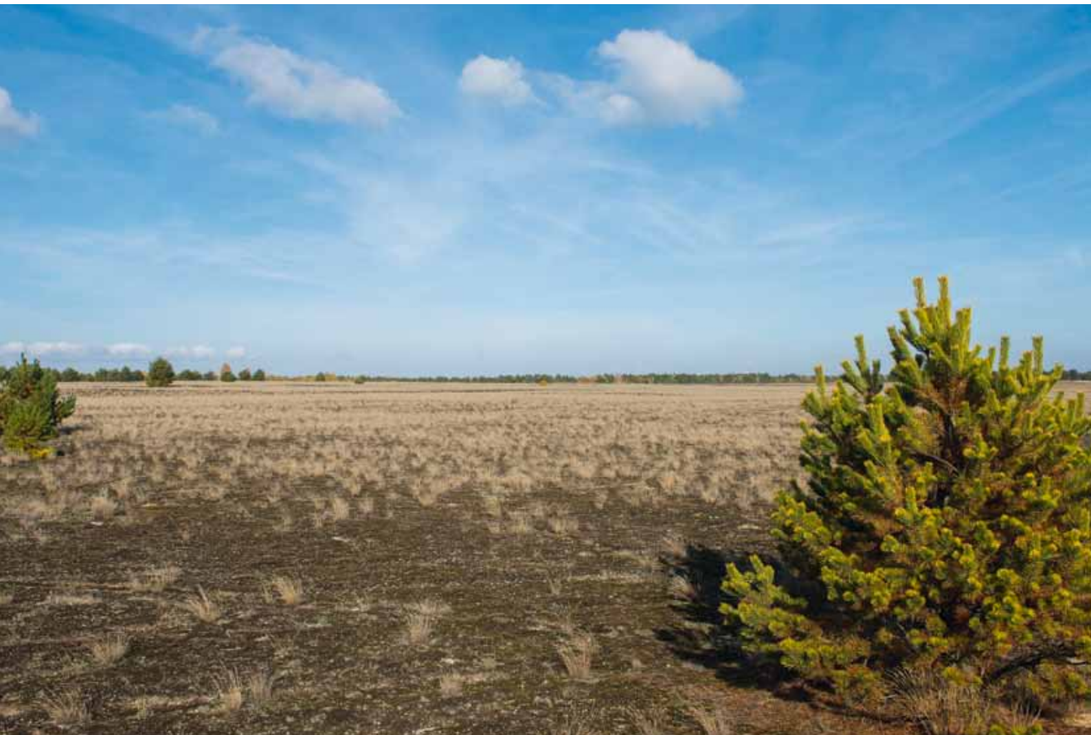
... in ehemals militärisch genutzten Gebieten ...