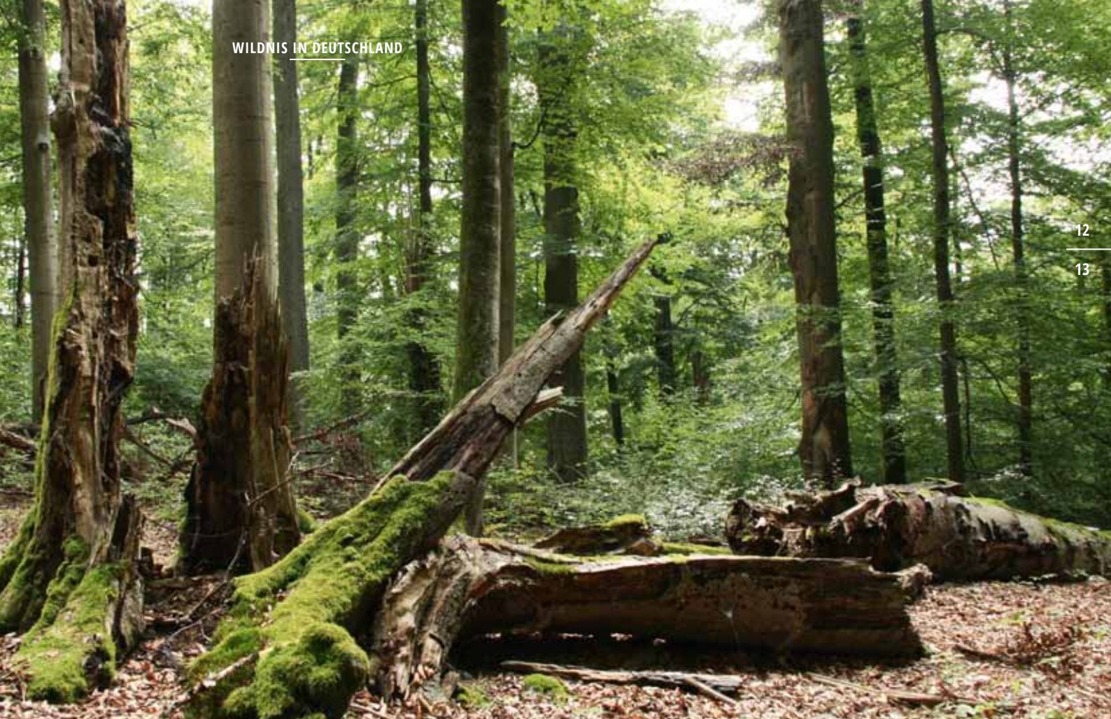
... in Wäldern ...