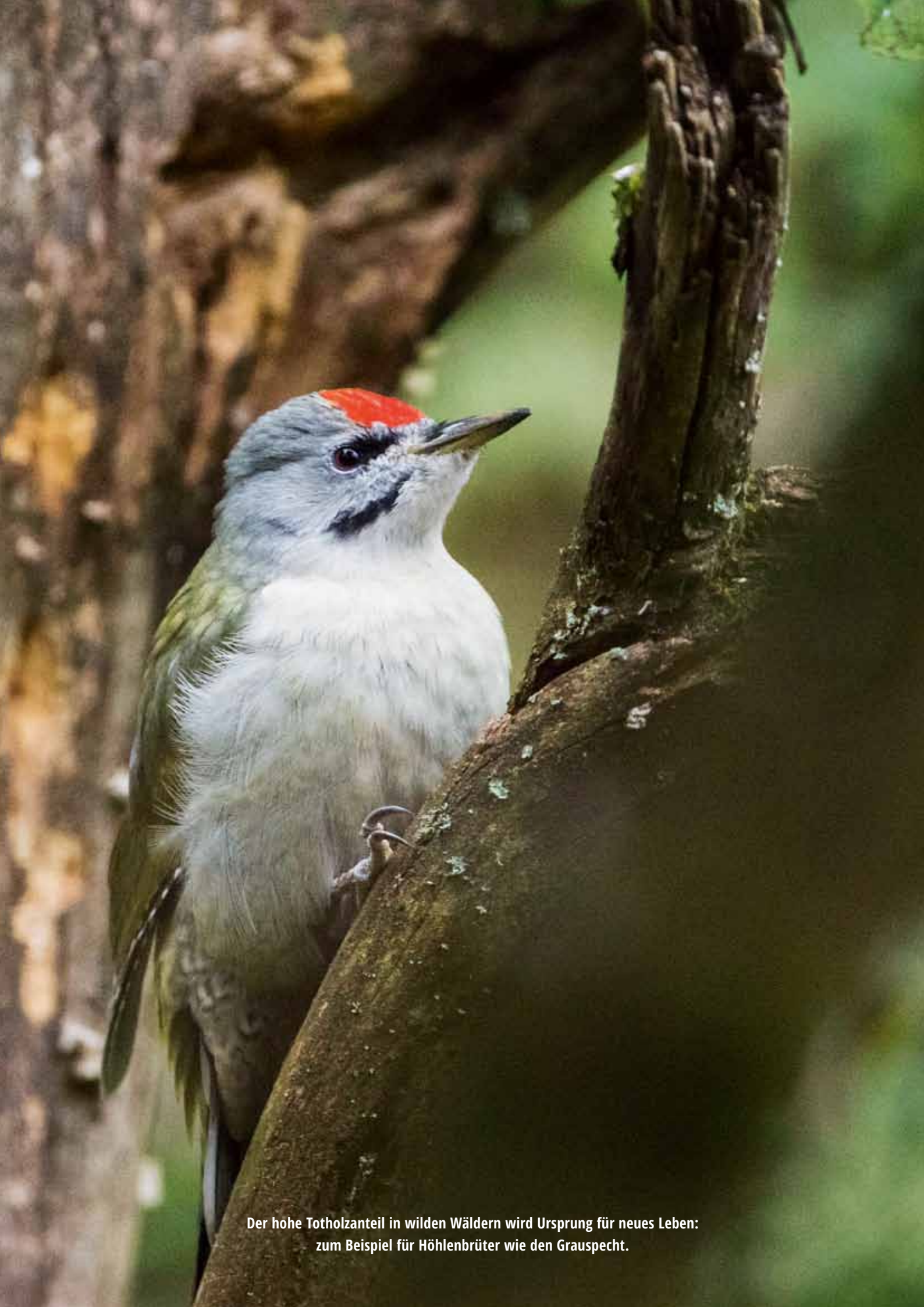
Der hohe Totholzanteil in wilden Wäldern wird Ursprung für neues Leben: zum Beispiel für Höhlenbrüter wie den Grauspecht.