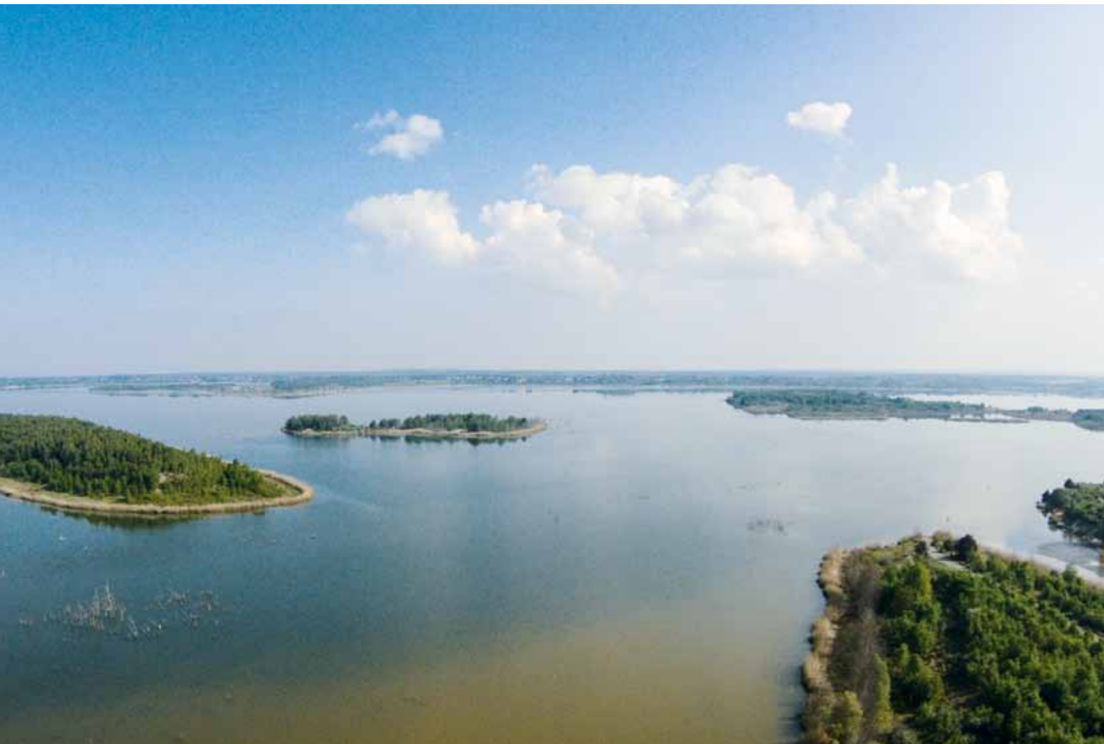
... und Bergbaufolgelandschaften liegen.