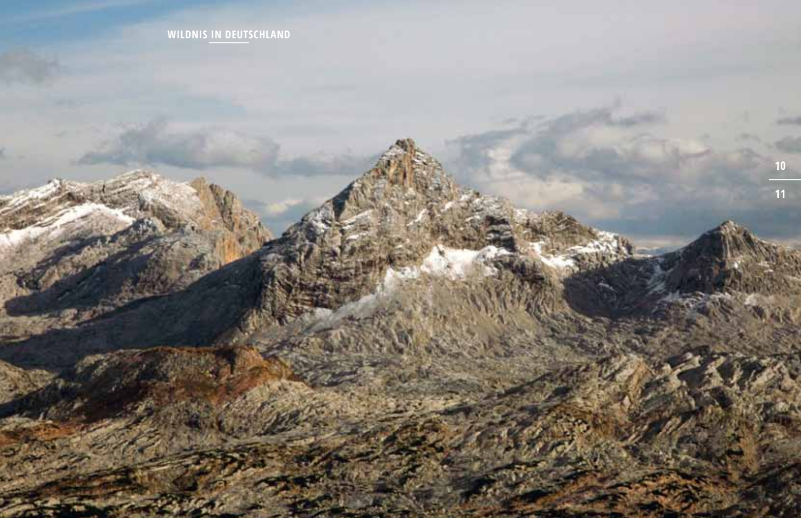
... im Hochgebirge ...