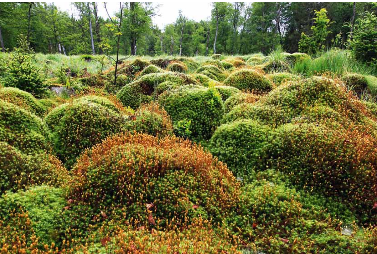
... in Moorgebieten ...