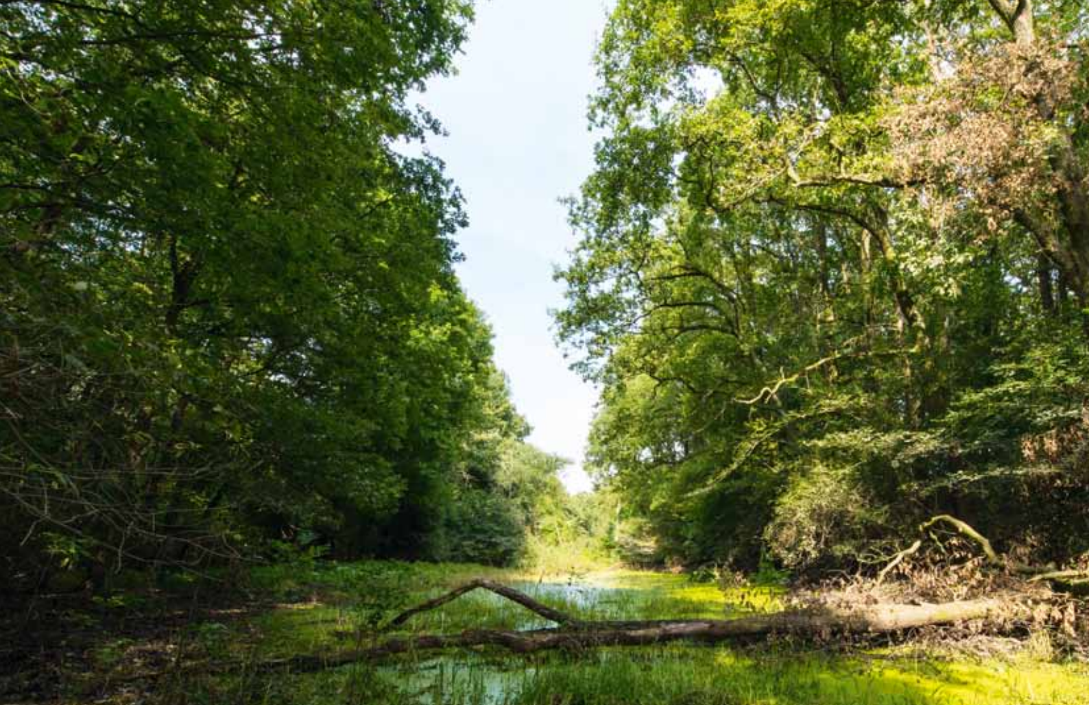
... in Flussauen und Seen ...